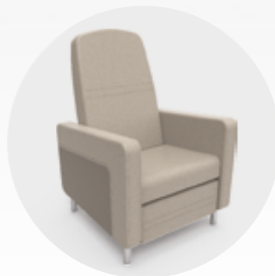
Opcional: Revestimento Duotone na Lateral.